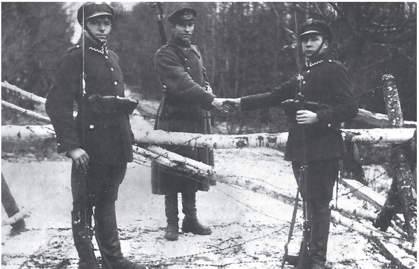
Lietuvos ir Lenkijos siena. XX a. trečiasis dešimtmetis.

Remiantis Lietuvos centriniame valstybės archyve saugomais neutraliosios zonos liaudies milicijos vyriausiojo štabo (f. 1219), Lietuvos šaulių sąjungos (LŠS, f. 561) dokumentais šiame straipsnyje mėginama rekonstruoti Lietuvos Respublikos ir Lenkijos okupuoto Vilniaus krašto nustatytą sieną saugojusių dalinių veiklą 1920-1923 metais. Pateikiami dokumentai neredaguoti, išskyrus prie dabartinių reikalavimų priderintą skyrybą, didžiųjų raidžių, žodžių, datos rašybą, taip pat techniškai sutvarkyti.