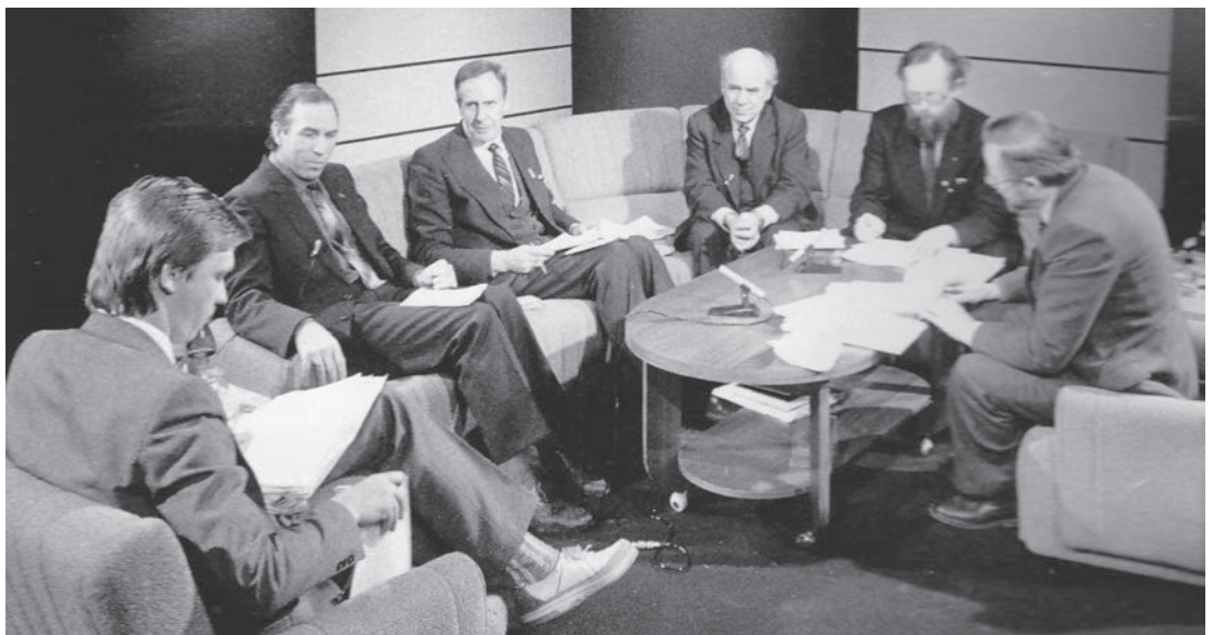
„Atgimimo banga“.