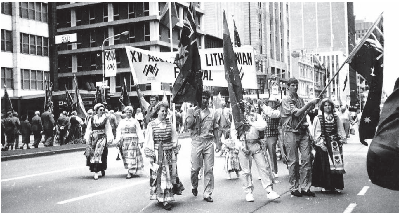
III Pasaulio lietuvių sporto žaidynių Adelaidėje (Australija) dalyvių eiseną. 1988 m. spalio