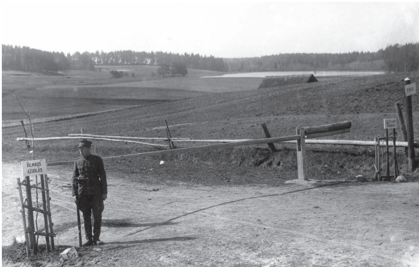
Prie demarkacijos linijos Puorių (Vilniaus aps.) perėjimo punkto pasodinti Vilniaus ir Tautos vado ažuoliukai.